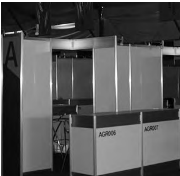
Exemplo Ilustrativo. Versão final pode sofrer variações.

Para cada projeto, além da área para afixação do painel / pôster, haverá uma mesa de apoio (em forma de balcão com tampo de 1,0m por 0,40m e 1,06m de altura) para a colocação de algum protótipo, material complementar ilustrativo da pesquisa, do diário de bordo e do relatório do projeto. Haverá também uma tomada com a voltagem informada por vocês até o dia 25/Fev/2015 no Sistema de Finalistas ( www.febbrace.org.br/finalistas/ ).